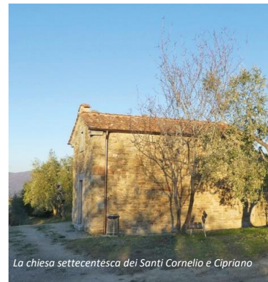
La chiesa settecentesca dei Santi Cornelio e Cipriano

Durante l'alto medioevo l'area di Castelsecco fu usata come fortilizio in una zona strategica nella lotta tra bizantini e longobardi . Vi furono eretti due edifici cristiani, la chiesa di San Pietro in Castro Sicco e la chiesa dei santi Cornelio e Cipriano . La prima presenta resti dell'abside del IX/X secolo a nord-est del teatro. Della seconda non c'è traccia, quindi è probabile che sorgesse dove oggi è situata la chiesetta di primo Settecento, che nel corso del XIX secolo divenne la cappella della famiglia Giusti, quella del noto poeta risorgimentale pistoiese Giuseppe Giusti . Il luogo fu frequentato dai discendenti fino al 1967, quindi fu abbandonato in seguito a una profanazione delle tombe.