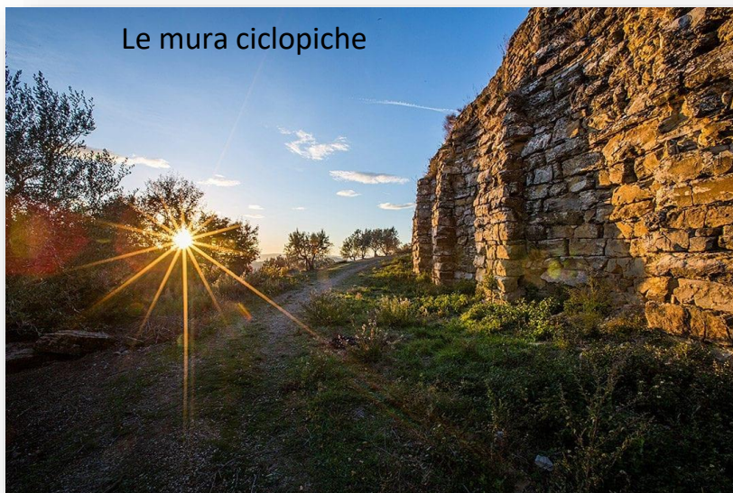
Le mura ciclopiche

Ridotta a rudere e sconsacrata, la chiesa è stata recuperata alcuni anni fa dall' Associazione Castelsecco APS nata nel 2002 per valorizzare un'area archeologica e naturalistica di inestimabile valore. Lì oggi sorge l'area archeologico-naturalistica di Castelsecco , che fu sede del principale santuario extra urbano tra quelli che cingevano l'Arezzo etrusca. Oggi l'area è sede di eventi, mostre e ritrovo per le iniziative all'aperto che si svolgono nell'area del teatro nei mesi estivi. I reperti archeologici ritrovati a Castelsecco in passato sono invece custoditi nel Museo Archeologico Nazionale "Gaio Cilnio Mecenate" di Arezzo.