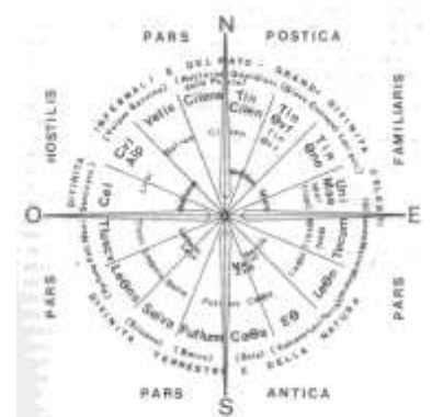
Fig. 13 - Divisione della vita etrusca secondo la divinazione etrusca. Sistema rituale nella base di Manfredo Capella (avanti del cerchio esterno) e del fegato di Manfredo (avanti del cerchio interno) con i nomi etruschi delle regioni.