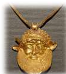
Oreficeria Pendente di una collana etrusca rappresentante la testa di Acheloo, 480 a.C. circa

Gli artigiani etruschi furono in grado di praticare le più sofisticate tecniche di lavorazione dei metalli preziosi: repoussé , incisione , filigrana e granulazione . In particolare, la granulazione è una raffinata tecnica di lavorazione dell'oro grazie alla quale gli Etruschi venivano considerati dei veri e propri maestri dell'arte orafa. Introdotta nel periodo orientalizzante, consisteva nell'applicare piccolissime sfere (granuli) d'oro in particolari decorazioni sui gioielli. Sottilissimi fili d'oro (di pochi decimi di millimetro di diametro) tagliati in minuscole parti fino a ottenere una sottile "paglia". Questa, mescolata a carbone in polvere, veniva compressa in un crogiolo (sigillato con argilla) e sottoposta a elevate temperature fino a raggiungere la fusione. La reazione chimica provocata dal carbone impediva all'oro fuso, durante il successivo processo di raffreddamento, di ricomporsi in maniera uniforme, costringendolo - invece - a "stracciarsi" formando una serie di minuscoli granellini. Raffreddati e lavati, si applicavano con una speciale colla (carbonato di rame, acqua e colla di pesce) spalmata direttamente sulla superficie del monile. Per saldare le sfere d'oro permanentemente al gioiello si