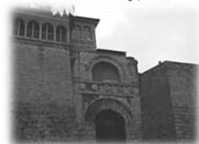
Perugia, Arco Etrusco

I primi insediamenti di cui siamo a conoscenza nel territorio risalgono ai secoli XI e X a.C., con la presenza di villaggi nei pressi delle falde dell'altura perugina e a partire dall'VIII secolo a.C. anche sulla sommità del colle dove sorgerà la città. Il rapido sviluppo di Perugia è favorito dalla posizione dominante rispetto all'arteria del fiume Tevere e dalla posizione di confine tra le popolazioni etrusche e umbre. Gli Umbri cederanno all'affermarsi del popolo etrusco, attestandosi definitivamente a est del Tevere.