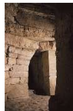
Tomba etrusca della Montagnola, VII secolo a.C., Sesto Fiorentino