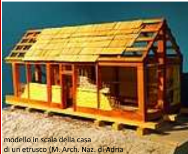
modello in scala della casa di un etrusco (M. Arch. Naz. di Adria)